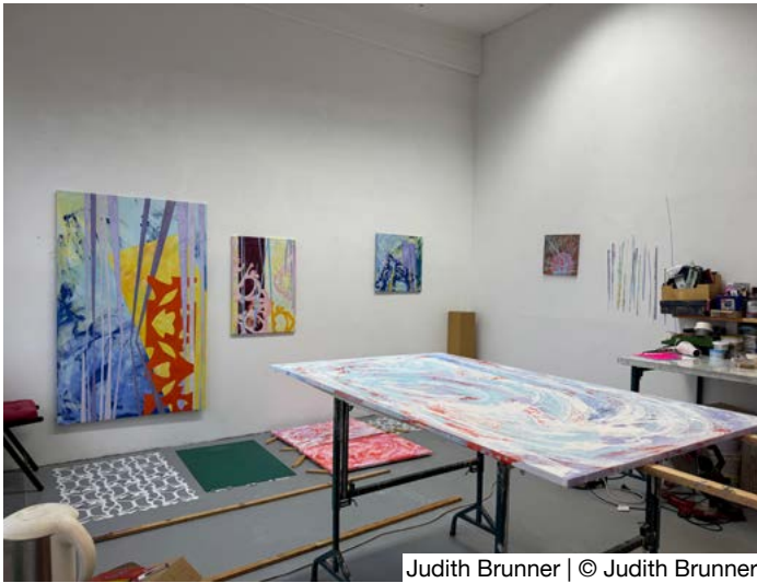
Judith Brunner | © Judith Brunner