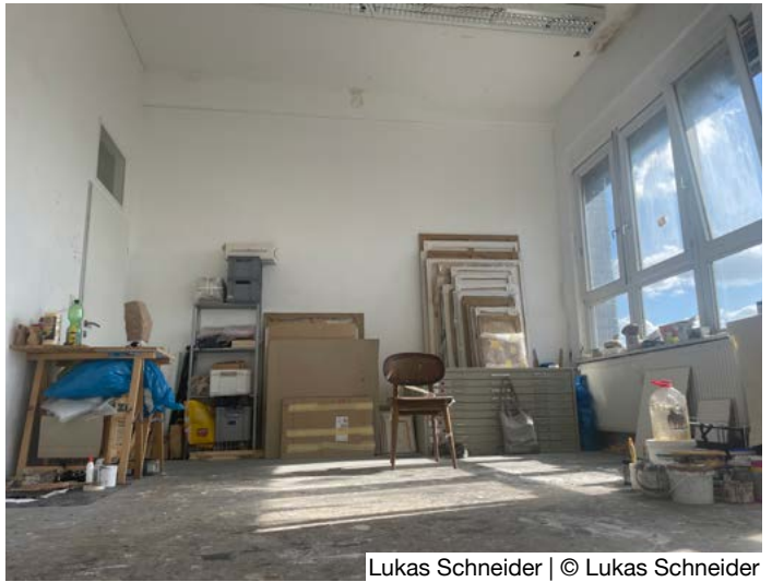
Lukas Schneider | © Lukas Schneider