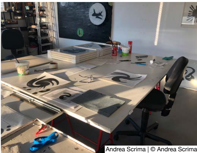
Andrea Scrima | © Andrea Scrima