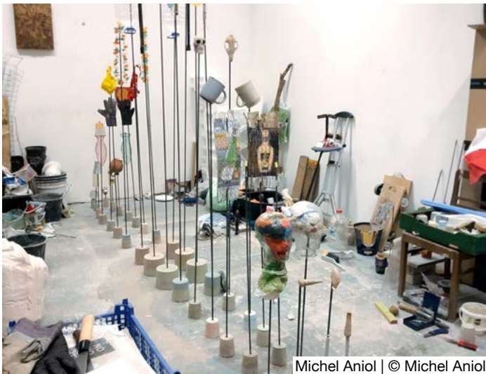
Michel Aniol | © Michel Aniol